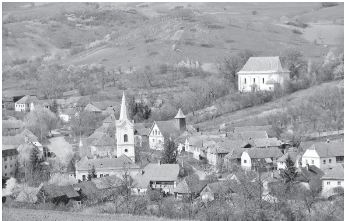
Vajola madártávlatból – jobb oldalon a szász evangélikus templom

Bonyháról lehet megközelíteni Gógánváralját, majd Kundot. Gógánváralja Árpád-kori eredetű magyar falu, temploma is e korszakban, valamikor a 13-14. század fordulóján épült, román stílusban. Az első írott forrás 1332-ben említi. 1911-ben a templomból az Erdélyi Múzeum gyűjteményébe került egy latin feliratos téglá, melyből kiderült, hogy az épületet eredetileg a Szent Szűz tiszteletére