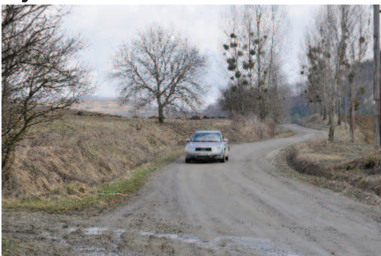
A nyárádselyei út jelenlegi állapota

Mintegy két hónap múlva a községben hozzáfognak az utcai lámpatestek cseréjéhez. A Nyárádmenti LEADER csoporton belül a község sikeresen pályázott támogatásra. Az országos vidékfejlesztési alapból 44.000 eurót (héa nélkül) fordíthatnak 200 villanyoszlop és világítótest cseréjére. A jelenlegiek helyére LED-égsző fényszórók kerülnek. Ezenkívül a faluközpontokba az időt és a hőmérsékletet mutató elektronikus