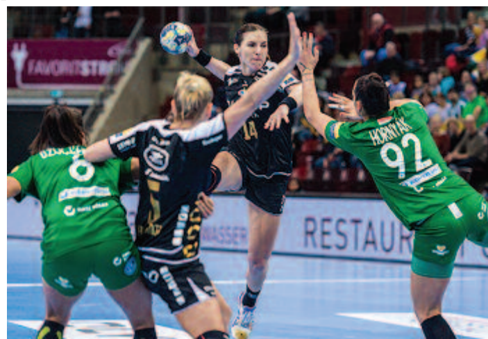
A magyar csapat 18 percen át jól tartotta magát, utána viszont meglepően sokat hibázott támadásban, és mivel a védekezése sem volt hatékony, a hazaiak fokozatosan elhúztak.